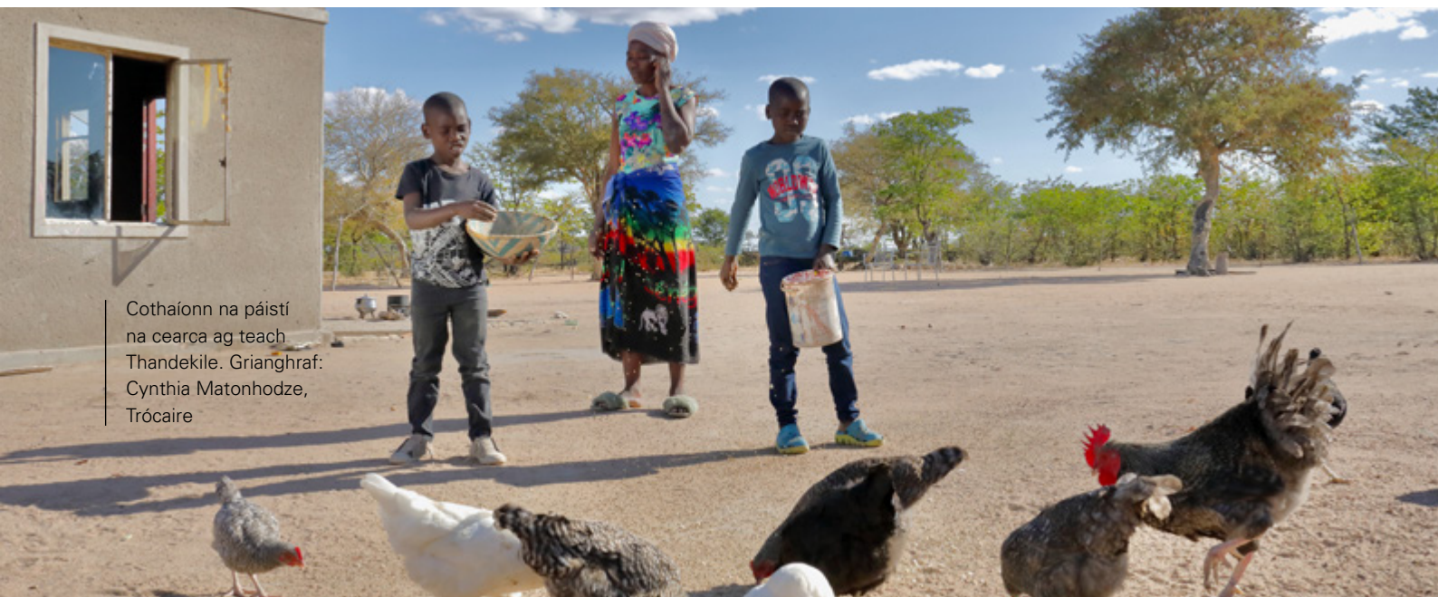
Cothaíonn na páistí na cearca ag teach Thandekile.

Goilleann an triomach, an t-athrú aeráide agus an chailliúint ar an teaghlach seo, ach ní amhlaidh don uile dhuine a chónaíonn sa tSiombáib. Ba mhaith an rud é dá bhféadfaí eilimintí deimhneacha na tíre a lua nuair is féidir. Tá cuid mhaith tír eile in ilchríoch na hAfraice seachas an tSiombáib. Ná cuir síos ar na teaghlach seo go gcónaíonn siad san Afraic. Spreag na daoine sa bhaile, sa pharóiste nó ar scoil le gúgláil a dhéanamh ar an tSiombáib agus cúig fhóras a lorg mar gheall ar an tír, sula gcuirtear tús le gníomhaíocht ar bith. Cuir béim ar ilchineálacht na tíre, agus ar ghnéithe deimhneacha an chultúir. Cuir na fórais thuas i gcomparáid le fórais chomhfhreagracha na hÉireann.